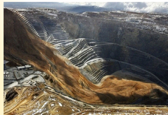
MINE DE LITHIUM