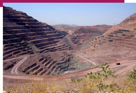
MINE DE FER

POUR NE CITER QUE LES PLUS CONNUS ! MAIS AUSSI DU PAPIER ET DU PLASTIQUE !