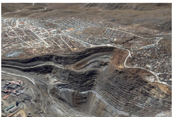
MINE DE ZINC