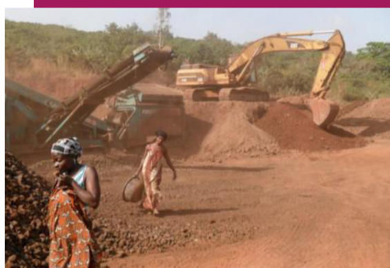
MINE DE MANGANÈSE