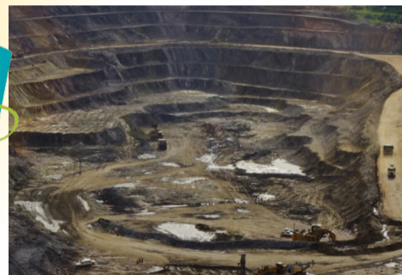
MINE DE COBALT