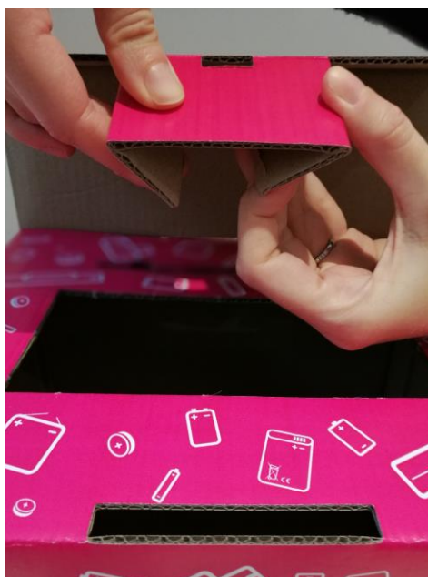
2 Rabattre les coins de l'embout vers l'intérieur