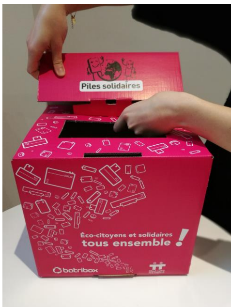
1 Retirer l'embout de l'encoche arrière