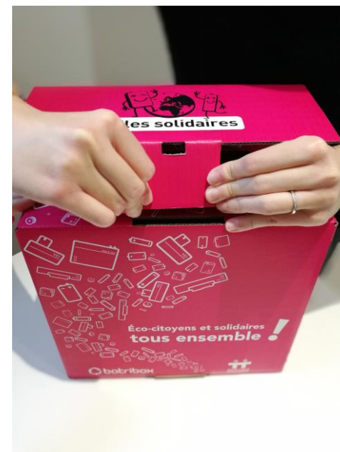
3 Glisser l'embout avec les coins rabattus dans l'encoche frontale