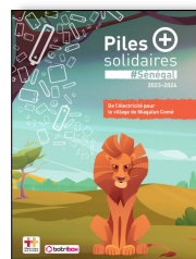
1 Livret d'information