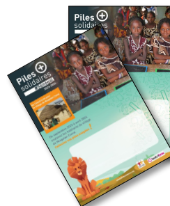
5 Affiches A3 personnalisables