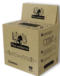
3 ou 6 Cartons de collecte