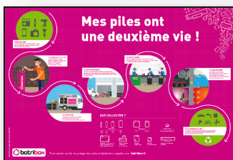
2 Posters Batribox