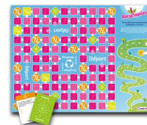
2 Plateaux de jeu et ses cartes à jouer : le RECYCLAPILES